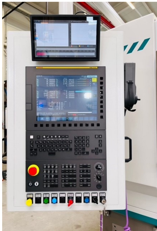
Tschudin MBF 453U – Bild 5 von 5