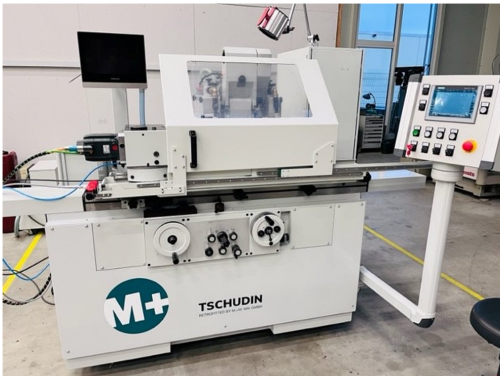
Tschudin HTG 610U-660 – Bild 2 von 5