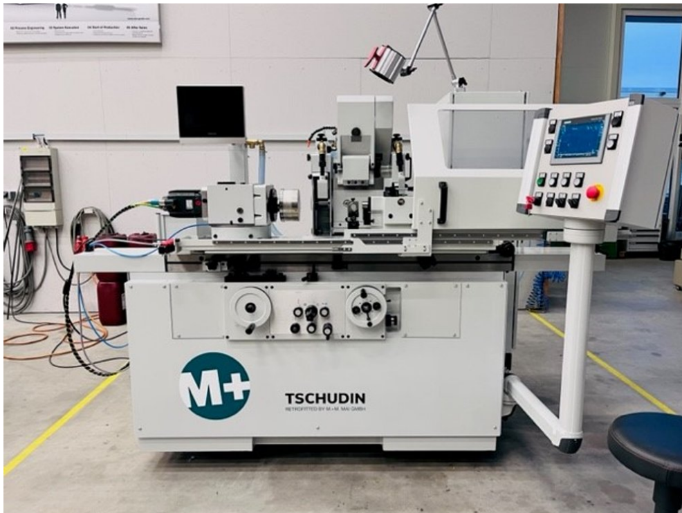
Tschudin HTG 610U-660 – Bild 1 von 5