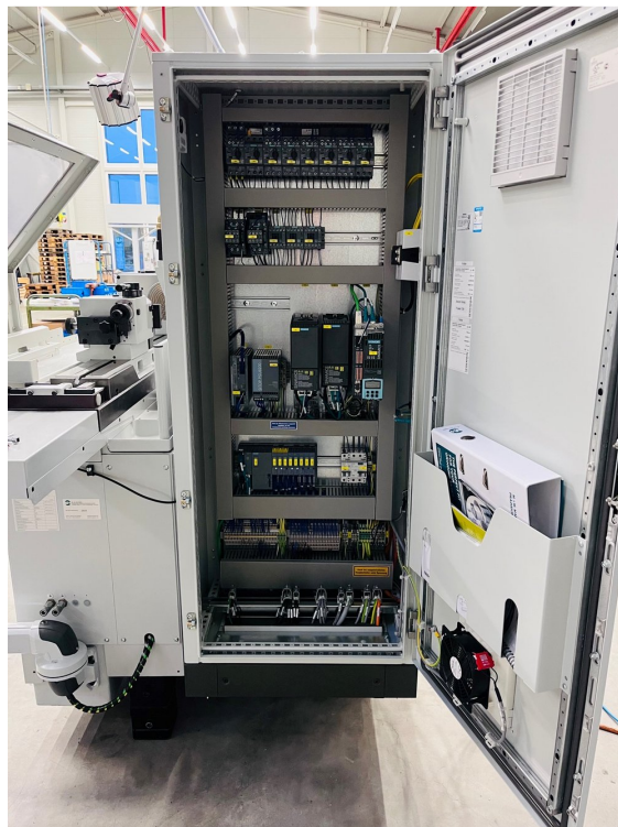
Tschudin HTG 610U-660 – Bild 5 von 5