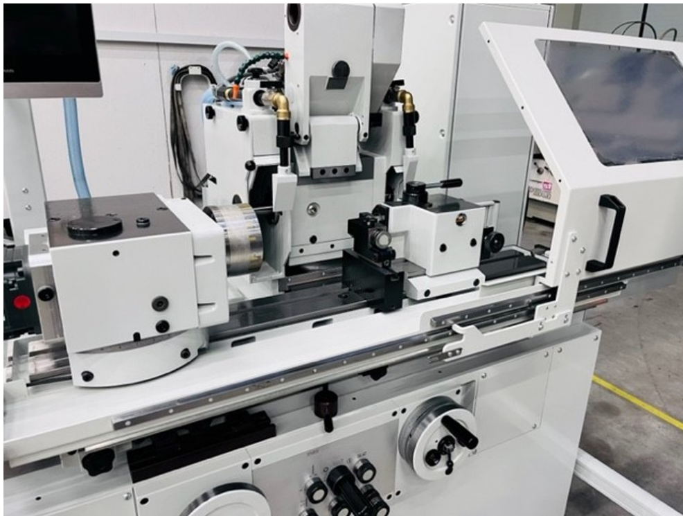
Tschudin HTG 610U-660 – Bild 3 von 5