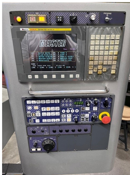
AMADA MEISTER G3 – Bild 4 von 7