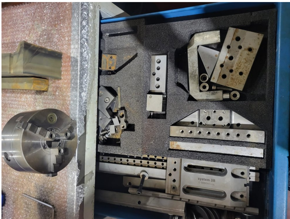
FANUC ROBOCUT ±iD – Bild 6 von 8