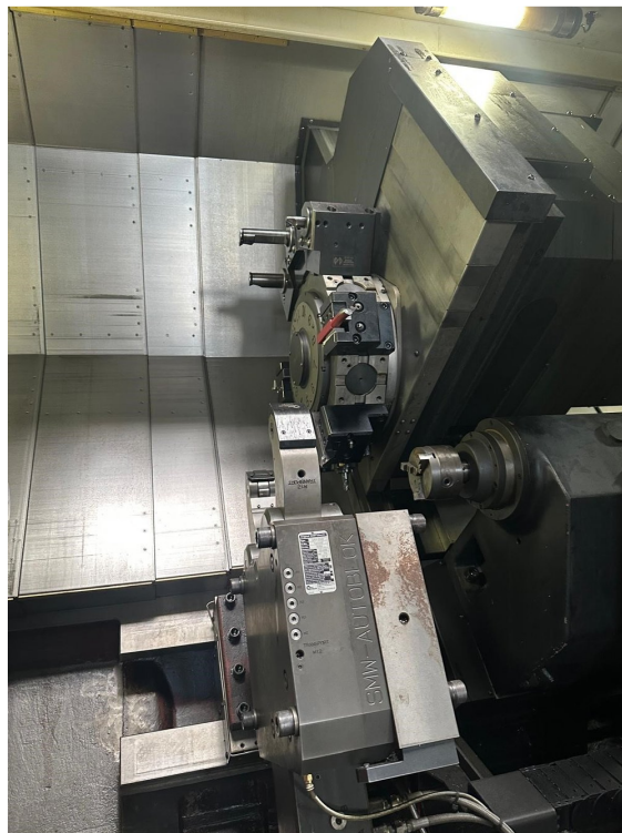
SMEC PL 45LY – Bild 5 von 5