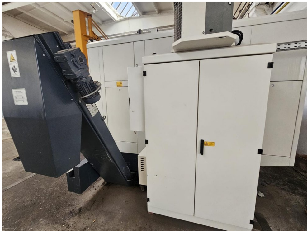
HEDELIUS Tilenta 7 Magnum – Bild 3 von 7