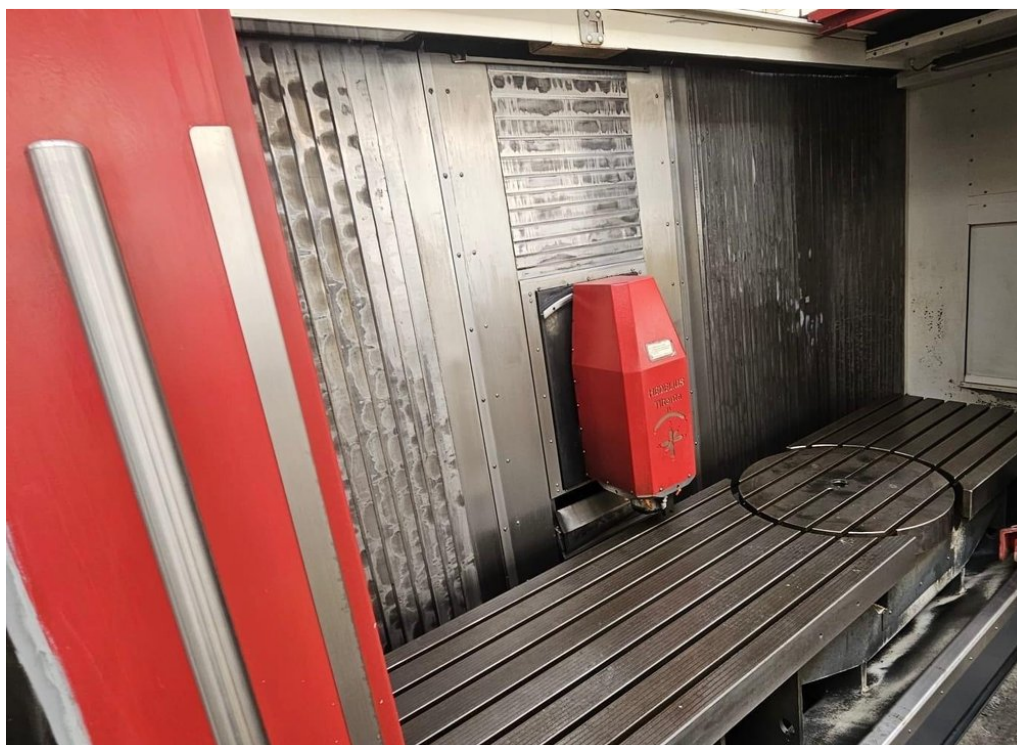
HEDELIUS Tilenta 7 Magnum – Bild 4 von 7